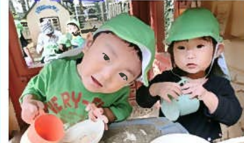
いっしょに遊ぼうよ~