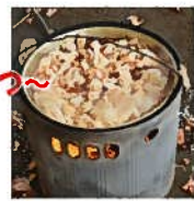
玉ねぎの皮を煮出した汁で染めます。