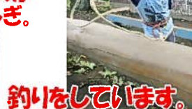
釣りをしています。何が釣れるかな?