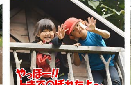
腕の力もついてきました。