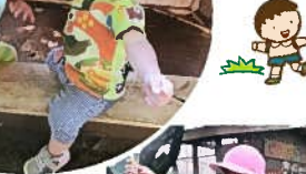
影も一緒に動くのがとってもふしぎ。