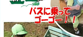
バスに乗ってゴーゴー!!