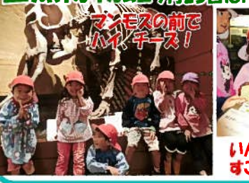
自然博物館 9月25日たけ組