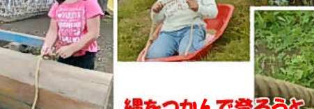
縄をつかんで登ろうとがんばってます!