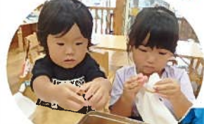
糊ゴムをくるくる