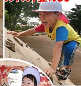
スライスイ登れるよ~