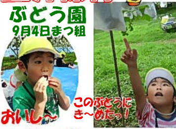
ぶどう園 9月4日まつ組