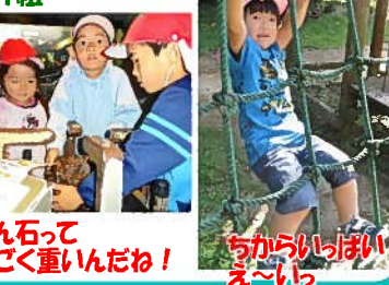
いん石ってすごく重いんだね!