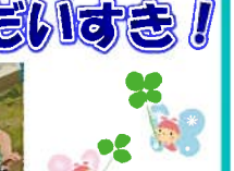
縄をつかんで登ろうとがんばってます!