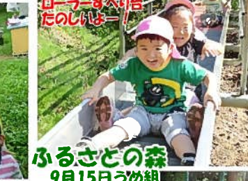
ふるさとの森 9月15日うめ組