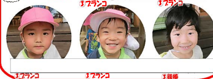
37ランコ 37ランコ 3鉄棒