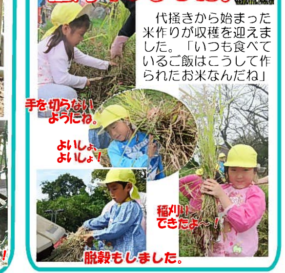
代掻きから始まった米作りが収穫を迎えました。「いつも食べているご飯はこうして作られたお米なんだね」