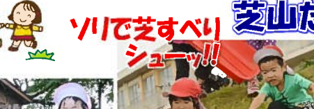
川で芝すべりシューッ!!