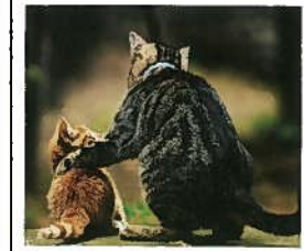
ダ×なところは誰にでもある

毎週水曜日、まつ組では万蔵院に出かけて礼拝に参加しています。そのときにお唱えするお経が「般若心経」です。本屋でネコさんが登場するかわいい解説書(?)を見つけたので紹介します。